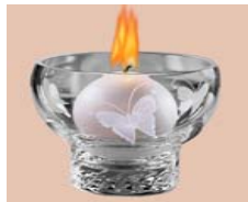
Luz de vela

La conmemoración Candlelight surge en 1983 en momentos de confusión y errada concepción de una enfermedad desconocida que afectaba a la población gay en San Francisco, Estados Unidos. Las personas fallecían en el año, considerando la situación como un misterio. Sin contar con apoyo político, cuatro jóvenes decidieron hacer visible la enfermedad, coordinando una pequeña vigilia.