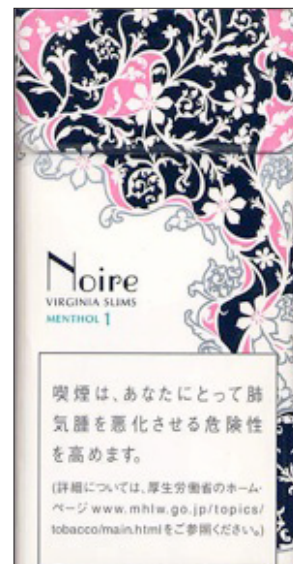
Cigarrillos Virginia Slims Noire de la empresa JTI (Japón)