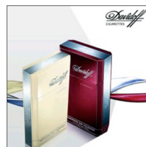
Cigarrillos Davidoff de la empresa Imperial Tobacco