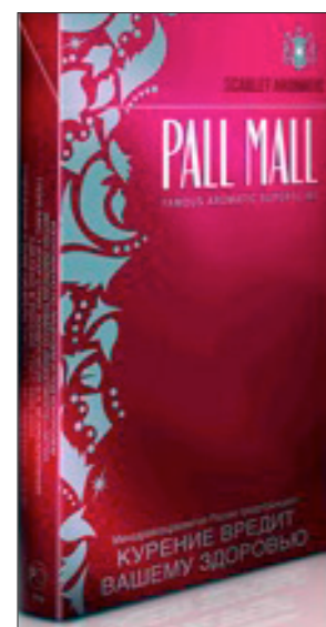
Cigarrillos Pall Mall Scarlet Aromatic de la empresa BAT (Rusia)