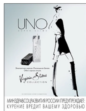
Publicidad de los cigarrillos Virginia Slims Uno de la empresa JTI (Rusia)